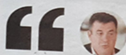
Román Rodríguez CONSELLEIRO DE CULTURA E TURISMO

Sanxenxo es el concello donde se acumula el mayor número de plazas hoteleras, una cifra que representa el 13,5 %. Le sigue el Ayuntamiento de Santiago, con 5.721 plazas, un 10,4 % del total. Vigo sería el tercero, con 4.192 habitaciones disponibles.