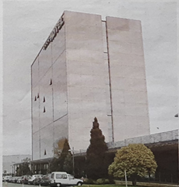
Hotel en Santiago beneficiario del Plan MAT.

Por otro lado, la Consellería de Economía también habilitó, a través del programa Reforma Tur, tres millones de euros dirigidos a 500 entidades con el mismo objetivo de impulsar la renovación.