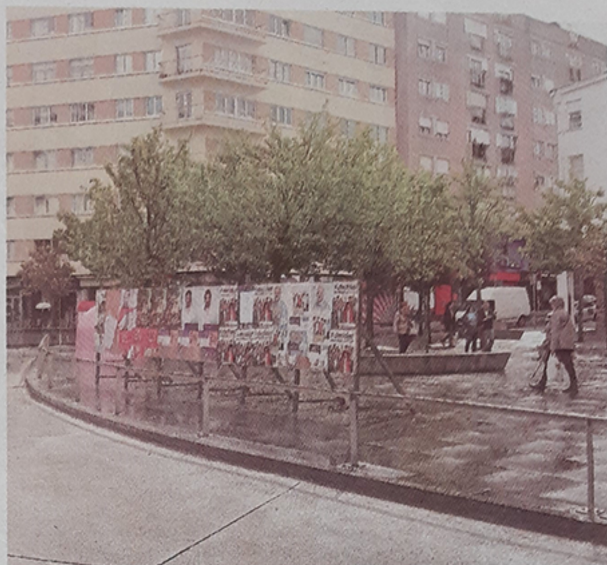
Panel habilitado para cartelería electoral en Santiago.

"Deberían ser obrigatorios e contar con todos os que teñan representación parlamentaria"