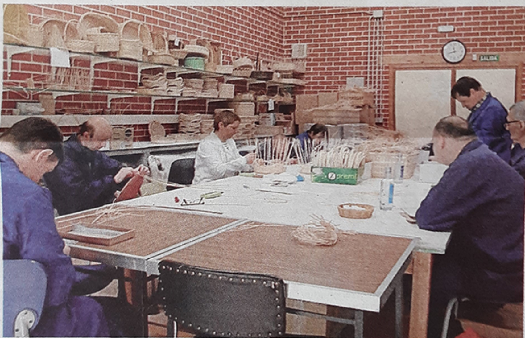
Algunos de los participantes en uno de los talleres que organiza Aspas para sus usuarios.