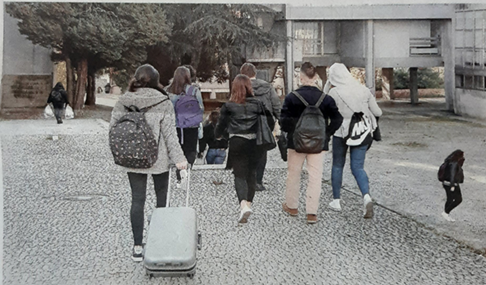
Estudiantes universitarios delante de una de las facultades del Campus Norte de la USC.

No es la única que se centra en estos dos puntos. Daniel, de 23 años, también tiene que claro que los dirigentes tienen que mirar por la enseñanza pública e implementar un sistema eficaz de ayudas para prácticas, clave para entrar, dice, en el mundo laboral. Este alumno de Filología Inglesa de la USC es plenamente consciente de